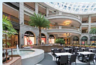
ショッピングモール